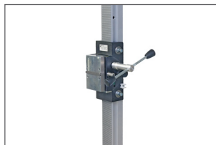
Connexion rapide du moteur grâce au raccord universel