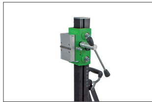
Raccord universel : connexion rapide ; manivelle réversible sans outils