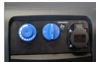
Mise en marche synchronisée lors du branchement d'une machine sur l'aspirateur