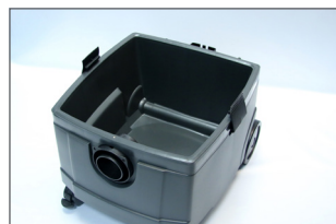
Cuve de 25 l.