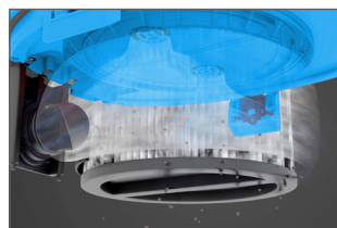
Filtre à cartouche HEPA 13 avec deux chambres de filtre indépendantes

Dispositif d'avertissement avec un signal acoustique et optique pour contrôler la puissance d'aspiration