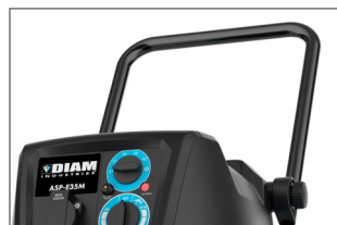
Poignée de poussée réglable et pliable pour un transport facile