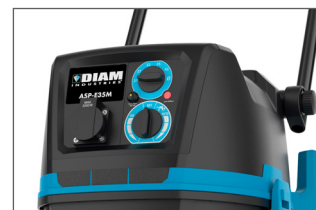
Sélecteur de puissance et diamètre du tuyau. Témoin lumineux et sonore