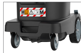
Roues extra-larges et roulettes pivotantes - adapté aux chantiers de construction