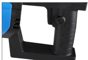
Poignée fusil, ergonomique, bonne prise en main