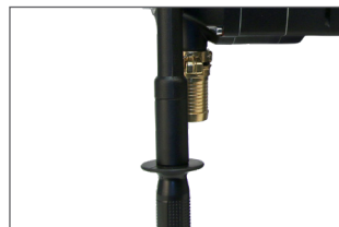
Connexion rapide à l'aspirateur