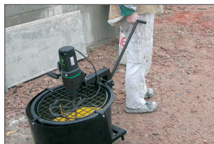
Facilement transportable grâce au chariot de transport