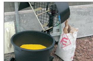
Dispositif inclinable pour un remplissage rapide