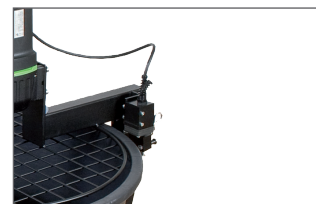
Coupe-circuit. Coupure en cas d'ouverture involontaire : protection de l'utilisateur