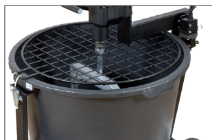
Grille de protection