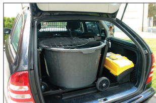
Station légère, peu encombrante. Démontage sans outils, rangement et transport facilités