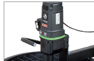
Moteur universel puissant, robuste, couple élevé. Interrupteur protégé de la poussière