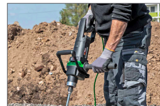
Bonne prise en main lors du malaxage de matériaux très visqueux