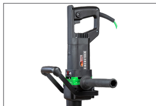
Poignée latérale et poignée sécurisée