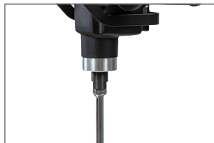
Raccord direct M14 : transmission optimale