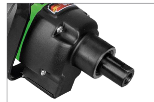
Raccord direct M14 : transmission optimale