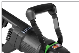
Poignée antidérapante et anti-vibration