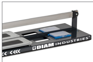
Boîtiers de rangement