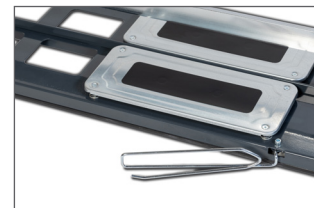
Plan de travail sur ressorts. Extensions latérales