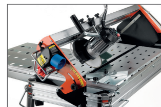
Tête de coupe inclinable à 45°