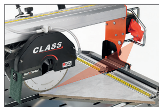
Laser de guidage

Pour prolonger la durée de vie de votre scie sur table, pensez à nettoyer la pompe à eau après chaque utilisation : plongez la pompe dans l'eau claire et faites tourner quelques minutes à vide.