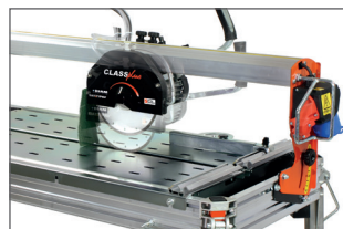
Profondeur de coupe réglable