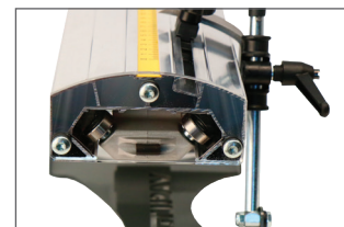
Rail de guidage équipé d'une voie en acier inox interchangeable