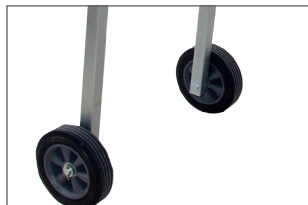
2 roues pour faciliter les déplacements