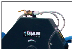
Double irrigation du disque pour un bon refroidissement pendant la coupe