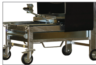
Roues + passage de fourche + anneaux de levage : transports facilités