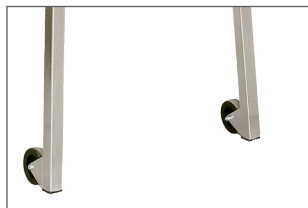
2 roues pour faciliter les déplacements