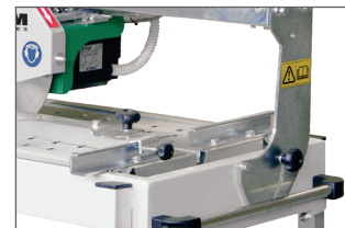
Tête de coupe inclinable à 45°