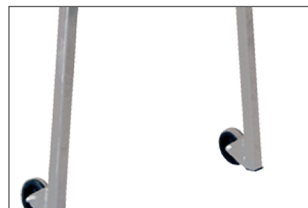
2 roues pour faciliter les déplacements