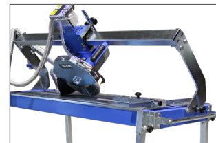
Tête de coupe inclinable à 45°