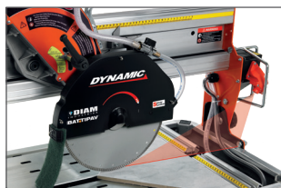
Laser de guidage