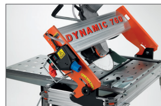
Tête de coupe inclinable à 45°