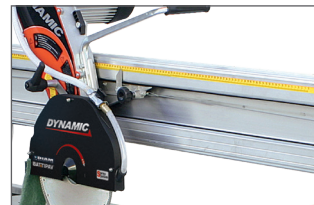
Réglette de longueur de coupe pour des travaux en série rapide