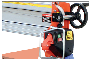
Avance semi-automatique par manivelle pour plus de précision et de confort