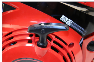
Lanceur étanche, empêche les ressorts et la corde de lanceur de casser