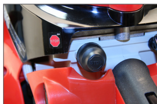
Bouton d'arrêt moteur, redémarrage rapide et facile du moteur