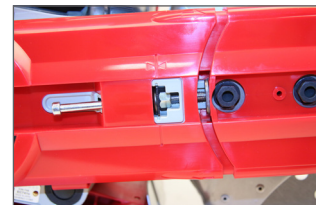
Tendeur de courroie facilement accessible