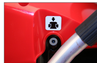
Valve de décompression