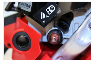
Pompe d'amorçage, démarrage rapide, corde de lanceur préservée