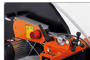
Ajustement de la profondeur de coupe par volant