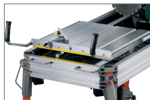
Avance manuelle de la table de coupe avec 2 poignées pour davantage de sécurité