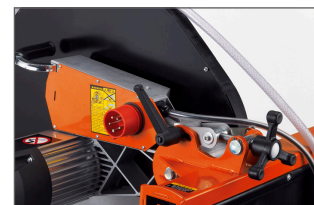
Réglage de la hauteur de coupe avec une molette et un levier de verrouillage