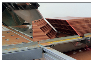
Tête de coupe inclinable à 45°