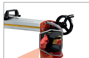
Avance semi-automatique par manivelle : plus de sécurité, coupe nette