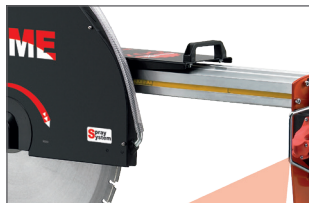
Réglette de longueur de coupe pour des travaux en série rapide