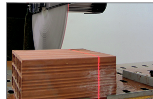
Laser de guidage