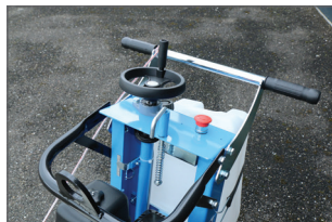
Réglage de la profondeur de coupe par volant