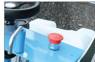
Bouton "coup de poing" pour les arrêts d'urgence