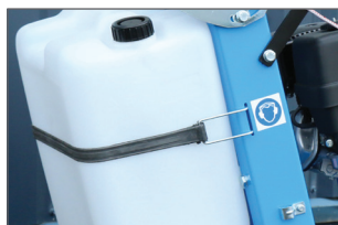
Réservoir d'une contenance de 25 litres avec accès facilité