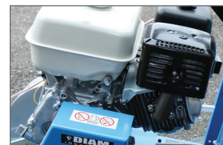
Moteur monté sur silent-block