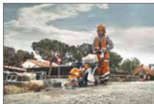
Découpes longues et précises grâce au chariot (en option)