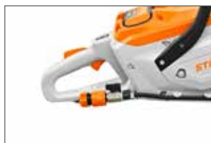
Raccord direct à l'eau pour diminuer la poussière lors de la coupe

Laissez la machine faire le travail, et veillez à ajuster régulièrement la vitesse pour un travail précis