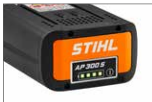
LED témoin de charge