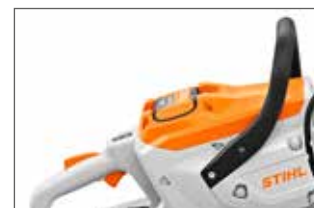
Batteries AP300S ou AP500S