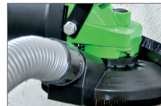
Raccordement direct à l'aspirateur pour une meilleure évacuation des poussières