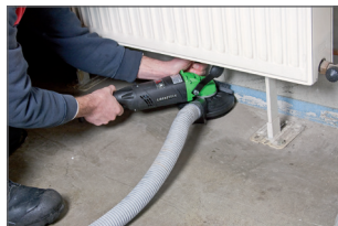
Très maniable, même dans les espaces réduits