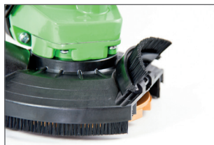
Capot d'aspiration amovible pour un ponçage au ras du mur