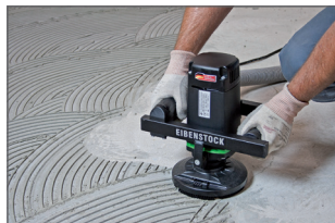
Poignées placées en parallèle pour + de confort et de stabilité