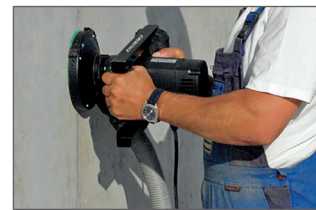
Raccordement direct à l'aspirateur pour une meilleure évacuation des poussières