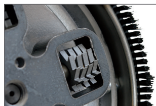
Molettes en carbure de tungstène très résistantes