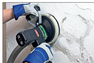
Raccordement direct à l'aspirateur pour une meilleure évacuation des poussières