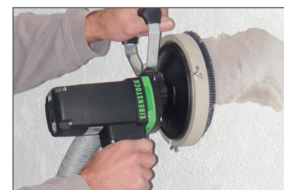
Poignée large et ergonomique = bon guidage, moins de vibrations