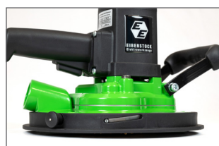
Réglage de la profondeur de fraisage - position basse