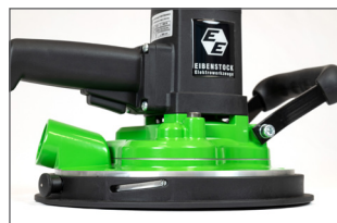
Réglage de la profondeur de fraisage - position haute