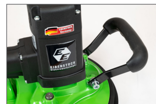
Poignée étrier, bonne prise en main