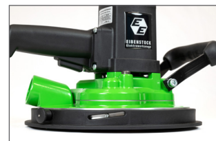
Réglage de la profondeur de fraisage - position intermédiaire