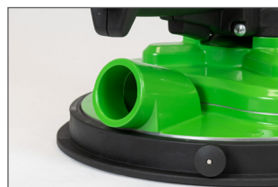
Connexion à l'aspirateur