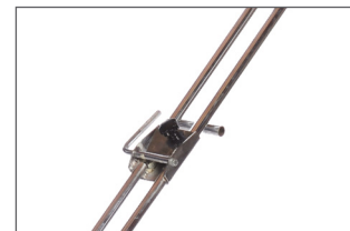
Levier pour plier le manche