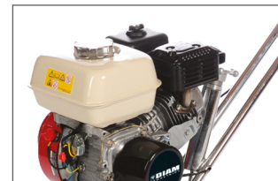
Réglage de l'inclinaison des pales à l'arrière du moteur