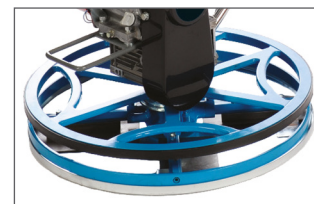
La bande de caoutchouc autour du carter permet de ne pas abîmer les murs