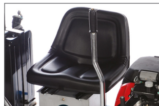
Siège totalement ajustable