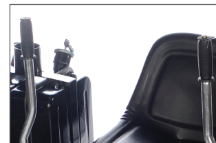
Manches ergonomiques avec commande d'arrosage