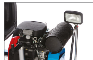
Eclairage par 2 spots