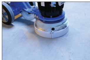
Partie du carter amovible : très pratique pour les travaux à fleur de mur