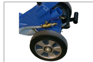
Raccordements directs à l'eau et à l'aspiration pour une meilleure évacuation des poussières