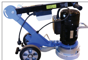
Bras pliable, très pratique lors du stockage